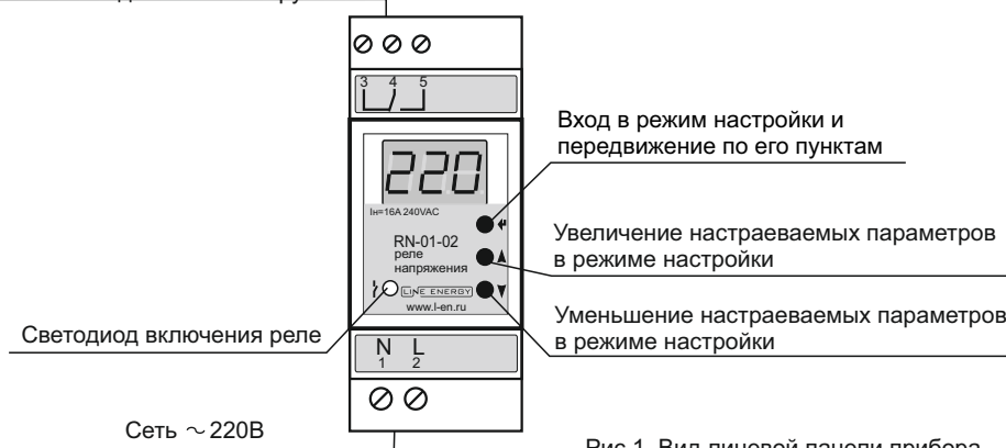
Рис 1. Вид лицевой панели прибора

6.2. В устройстве используются три кнопки управления и программирования параметров: